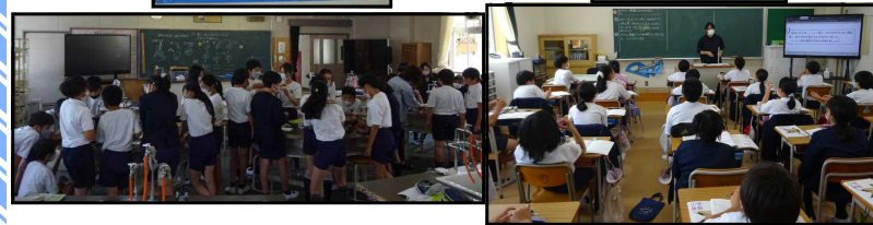
みんなが責任をもち 協力して 下級生を支える 6-4