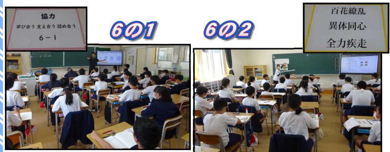
協力 学び合う 支え合う 認め合う 6-1

運動会の取組では、与原小の新たな運動会の成功に向け、大いに活躍してくれることでしょう。