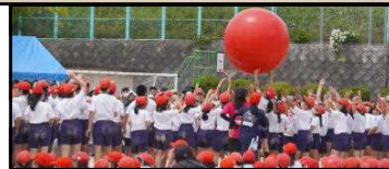
3年ぶりの全校競技「大玉送り」「全校応援」もできました!

今年度は保護者の参観方法について、PTAと協議を重ね、参観場所の指定や学年毎の入れ替わりなど、新たな運動会の参観方法を取り入れました。保護者の皆様には、ご理解、ご協力を頂き、ありがとうございました。おかげで、地域、保護者、全校児童が一体感のある『さすがの与原小・じまんの与原小』の運動会になりました。