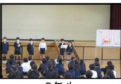
2年生 1年生との集会

身近な公共施設の使い方や交通ルールを知る。友達と活動することのよさや自然について知る。