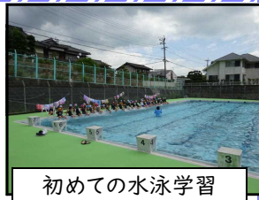
初めての水泳学習

各学年とも5回程度の学習が実施できました。多くの学年が、小学校で初めての水泳学習であり、水に慣れること、浮いたり息継ぎをしたりすることから始めました。水の事故防止についても学習に合わせて指導しています。もっと学習したいなど、「泳ぎ」が楽しくなっている児童も見られました。各家庭でも引き続き水の事故防止にご協力をお願いします。河川や海には子どもだけで行かないこと、家庭での水泳レジャーの際には、おうちの人と決めた約束や会場プールのルールを守ることなど確認をお願いします。