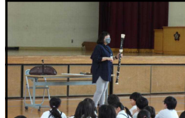
3年生 リコーダー講習会