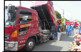
4年生 パッカー車の見学